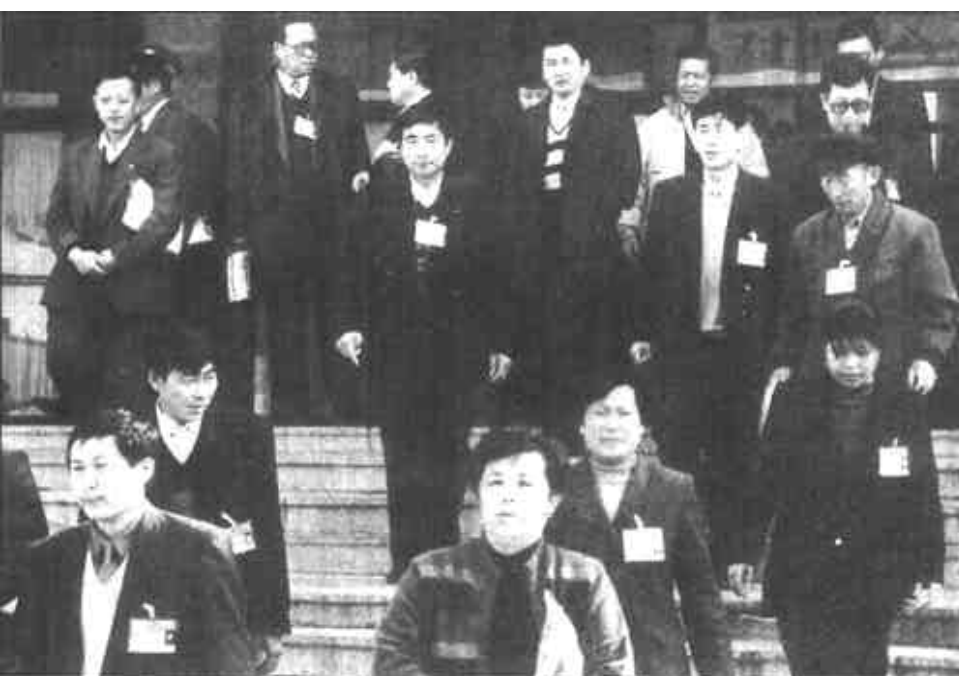
2月26日下午，市四届人大二次会议胜利闭幕。代表们满怀信心，纷纷表示，要把这次会议精神贯彻好，落实好，在各自的岗位上做出更大的贡献。

团结一致，迎难而上，抓好各项具体工作的落实是关键。落实是加强团结、万众一心、迎着困难上的最生动和具体的表现。现在，大政方针已定，下一步的关键在于抓好落实。要认真贯彻实施“工业强市”战略，加快产业结构调整步伐，膨胀工业经济规模，提高工业经济运行的质量和效益；要把大力发展个体私营经济作为经济增长的一个重点方面，下大气力去抓，放开手脚去干；要提高经济成分中的科技含量，加大科技投入；要加快农业发展，努力增加农民收入，切实保持农村稳定；要大力实施“科教兴市”战略，着力增强经济社会发展的推动力……这些看似原则的重点工作，需要层层分解，细化指标，责任到人，真抓实干，防止在一片落实声中落空。各级要集中精力，全力以赴抓落实。因为宏伟的蓝图只有抓好了落实，才能变成现实；没有落实的蓝图，只能是“空中楼阁”。我们要的是实实在在地落到实处，要的是进一步一个脚印地迎难而上、克服困难，赢得胜利。只要真抓实干，任何困难都会在我们面前退却，都会被我们战胜，我们的事业就会有新的、大的进步。对此，我们信心百倍! 新春新气象，正是奋进时。只要我们高举邓小平理论伟大旗帜，在市委的正确领导下，统一思想，坚定信心，团结一致，迎难而上，我市的改革开放和社会主义现代化建设事业就一定取得更大的胜利，就一定会把一个繁荣昌盛的东营带入二十一世纪。